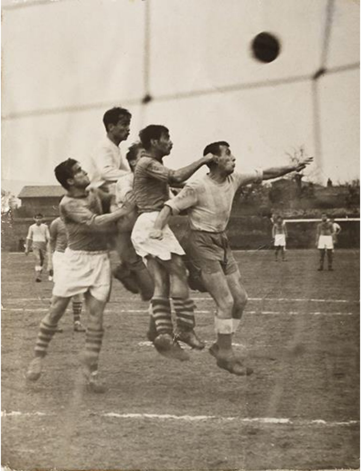
Demirspor İzmirspor Maçından Komik bir an