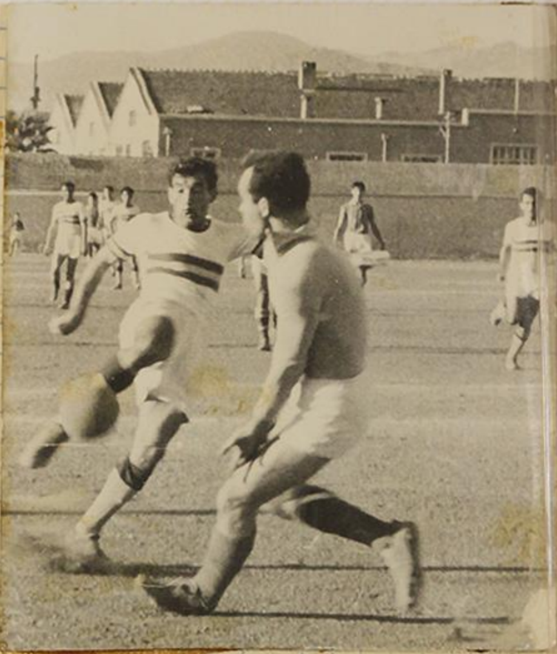
Demirspor - Ege Spor Maçından bir an