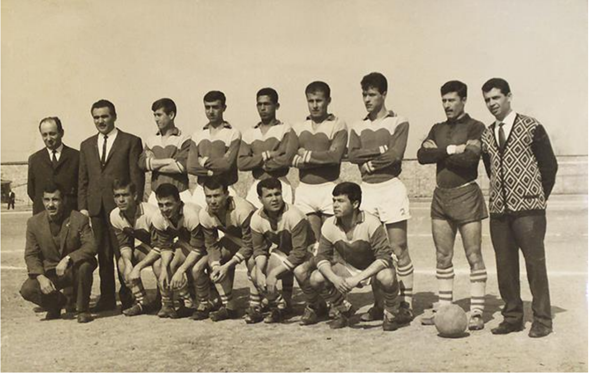
1966'da antrenörlüğünü yaptığı Manisa Mensucatspor takımı.